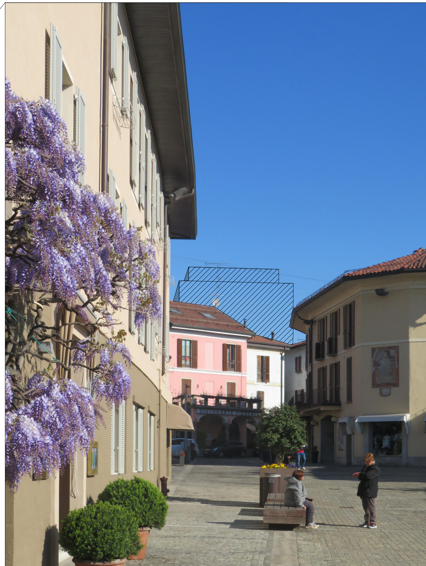
INGOMBRO DELLA SAGOMA DELL'EDIFICIO A TORRE IN PROGETTO DAL PUNTO DI VISTA (APERTURA TRA LA PIAZZA E IL LUNGOFIUME)